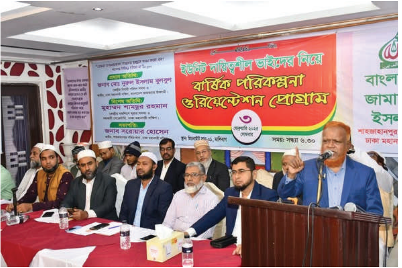
শাহজাহানপুর পশ্চিম থানা কড়ক আয়োজিত ইউনিট দায়িত্বশীলদের ওরিয়েন্টেশন প্রোগ্রাম অনুষ্ঠিত